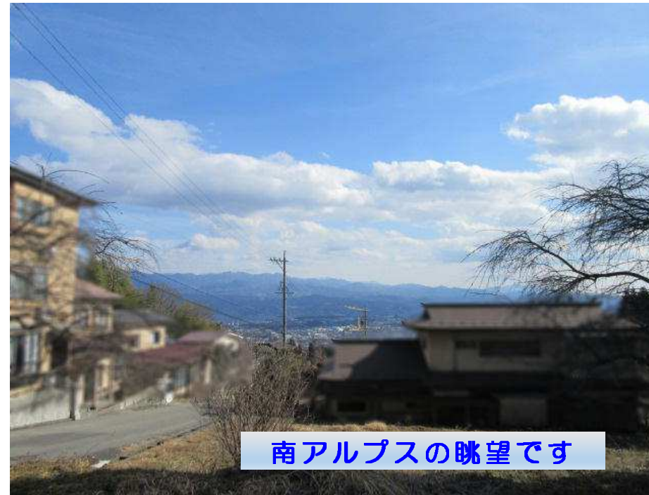
南アルプスの眺望です