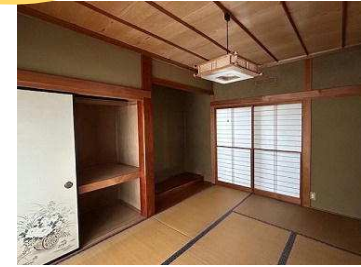
明るい和室8帖+8帖 続き和室 各部屋収納豊富です