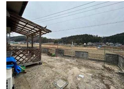
十分な敷地面積と眺望の良い立地