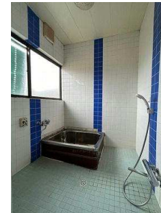
ゆとりのある水まわり お風呂・トイレです