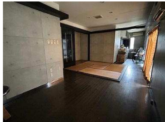
コンクリート調クロスの壁がおしゃれな洋室18帖 家族談笑の場に♪ 簡易キッチンもあります