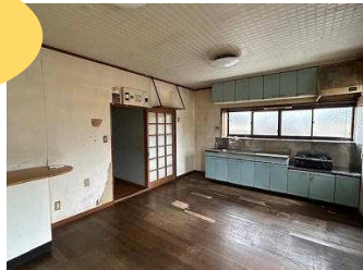
陽当たりの良い、リビング12帖です キッチンもゆとりのある大きさです