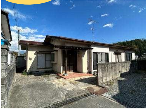
陽当たり、眺望良好の戸建て住宅です