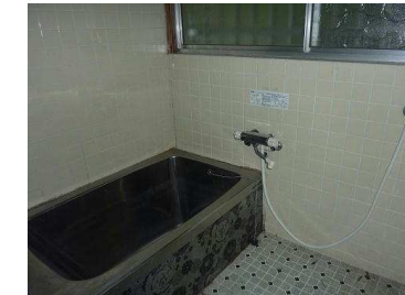
トイレ（温水洗浄機付き）、洗面台、お風呂