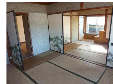
2階 ゆとりある4部屋で収納も豊富です 北側窓から見える眺望も良好です