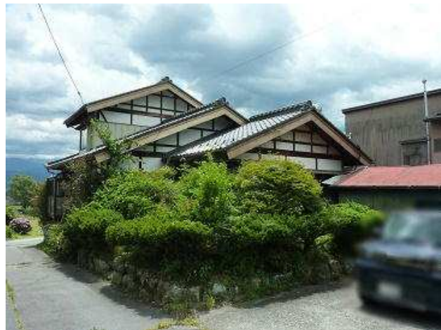
眺望と陽当たりに恵まれた住宅です