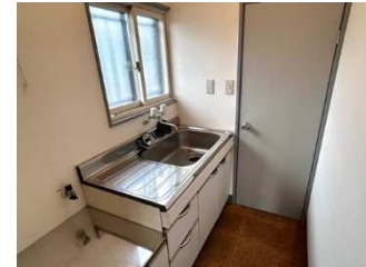
ミニキッチン・洗面・トイレを備えた、使い勝手の良いスペースです