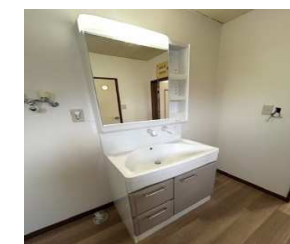
2階 気持ちよくお使いいただけるよう、洗面・温水洗浄付きトイレは新しくなりました