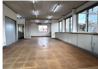
1階 多用途に対応できるフリースペースは事務所や各種教室や予約制サロンなど・使い方広がります♪ 住居兼用で開業をお考えの方にもおすすめの物件です