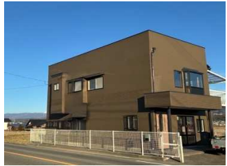
外観 全面外壁塗装済み 陽当たり・利便性良好住宅