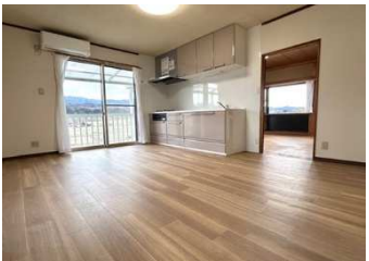
2階 新しくなったキッチンと、陽当たり良好な明るいリビング 眺望&陽当たり恵まれた居住スペースはご家族でゆったり過ごせる2LDK プライバシーを確保した落ち着いた居住空間です リビングを中心とした2階スペースは、忙しい毎日でも生活動線がスムーズ 暮らしやすさが魅力の物件です