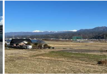
住宅からの眺望 夕焼けに染まる南アルプスも楽しめます