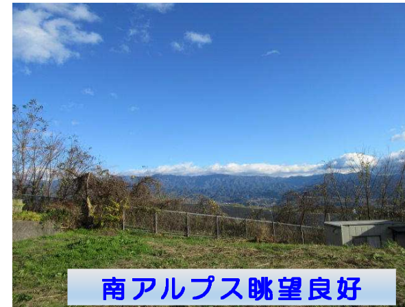
南アルプス眺望良好