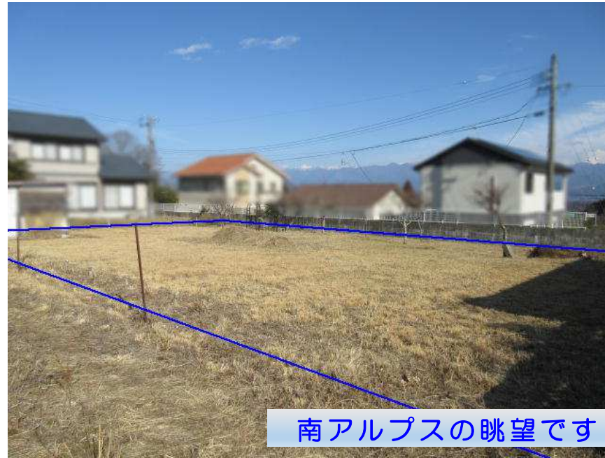
南アルプスの眺望です