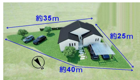
住宅配置イメージ図です 約30坪 平家住宅