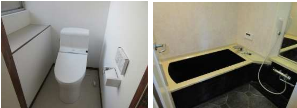
新しくなったキッチン トイレ(ウォシュレット付)と、追い炊き機能付きのお風呂