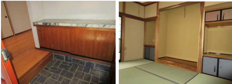
玄関と、和室・床の間の様子 和室の多い間取りは幅広い世代に人気