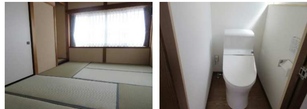
ベランダに続く6帖和室と、新しくなった3階のトイレ(ウォシュレット付)です