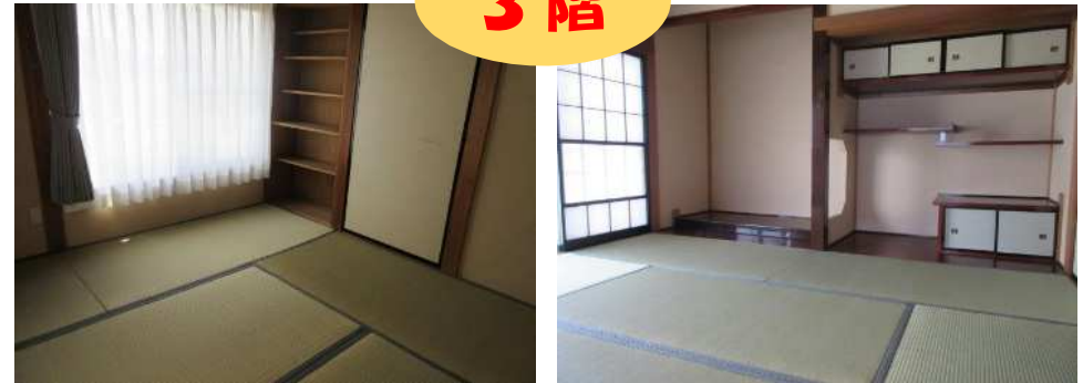
3階 四帖半和室と8帖和室です 床の間 床脇もあり客間にもおすすめ