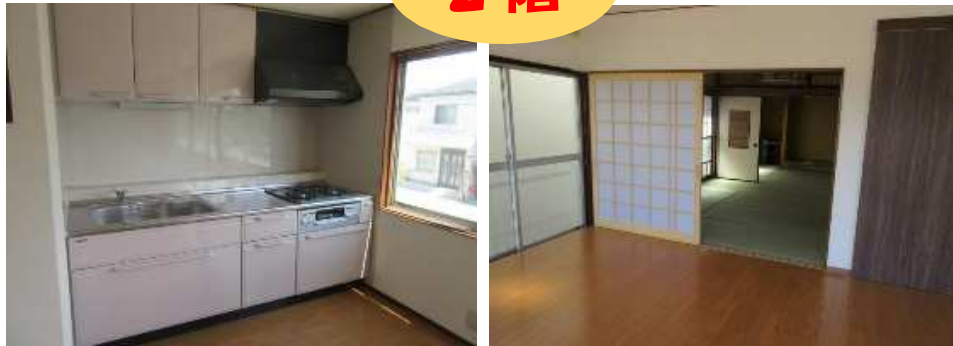
新しくなったキッチンとリビングから続く和室 陽当たりの良いリビングは明るく開放感があります