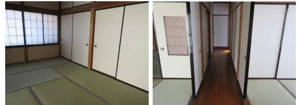
3階も部屋数多く、収納スペースもたっぷりあります