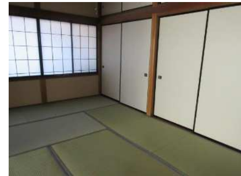
3階も部屋数多く、収納スペースもたっぷりあります