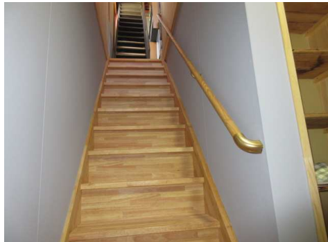
新規設置した階段、使いやすくなりました。和室の多い間取りは幅広い世代に人気です