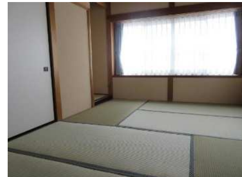
ベランダに続く6帖和室と、新しくなった3階のトイレ(ウォシュレット付)です