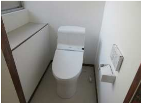
新しくなったキッチン トイレ(ウォシュレット付)と、追い炊き機能付きのお風呂