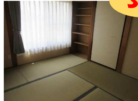
3階 四帖半和室と8帖和室です 床の間 床脇もあり客間にもおすすめ