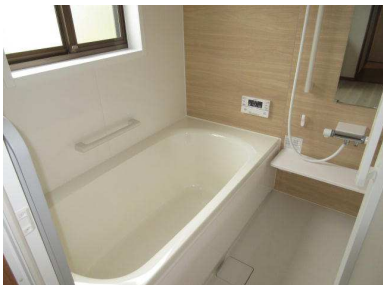
新しくなった 追い焚き機能付きのシステムバス