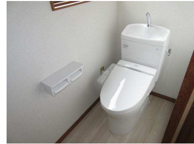
ウォシュレット付トイレです