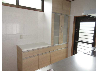
新しくなったシステムキッチンとリビング 対面キッチンの背面にも収納スペースがたっぷりあるのがうれしいですね