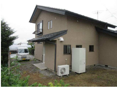
住宅外観 駐車スペース3台可能です