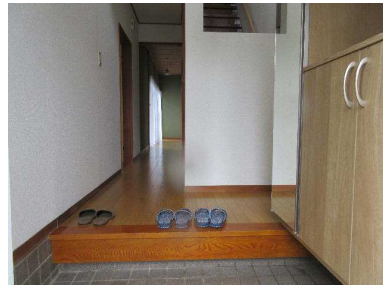
玄関 吹き抜けスペースは明るく開放感があります