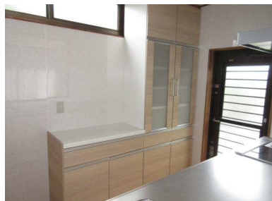
新しくなったシステムキッチンとリビング 対面キッチンの背面にも収納スペースがたっぷりあるのがうれしいですね