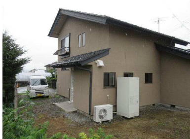
住宅外観 駐車スペース3台可能です