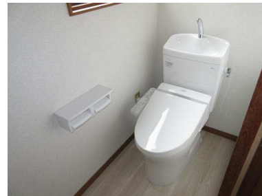
ウォシュレット付トイレです