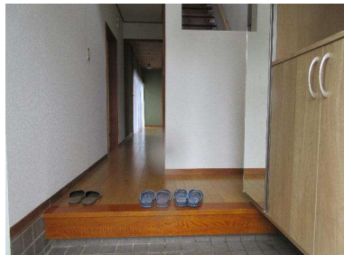
玄関 吹き抜けスペースは明るく開放感があります