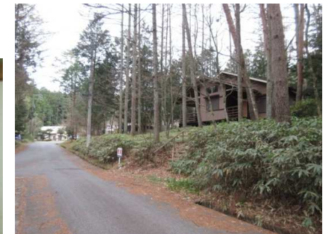
東側道路(約6m幅)から撮影