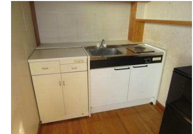
ゆとりある水まわり、2階にはミニキッチンもあります