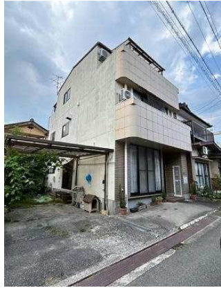
利便性の良い 中古住宅です