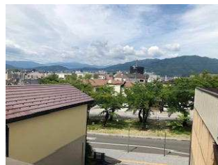
3階ベランダからの眺望です 桜並木が見えます♪