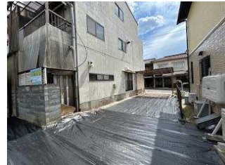
駐車3台可 内2台カーポート付きです