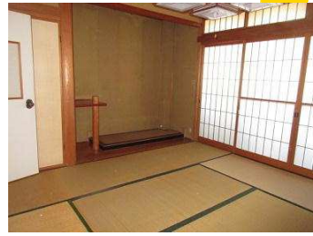
陽当たりの良い、広々とした部屋が多く、子育て世帯や大家族にもオススメです