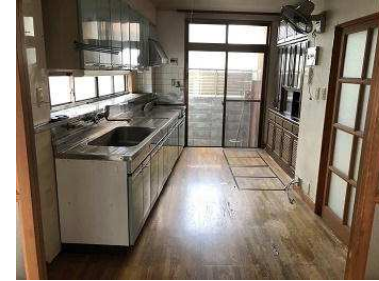
広々としたリビング、キッチン約8帖