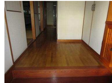
管理状態良好で、床板も綺麗です