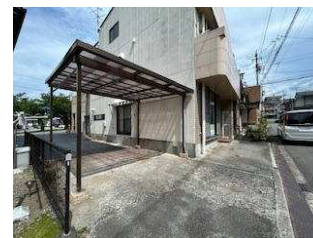
外まわりの整備が完了しました