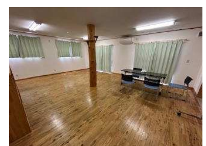
広々フリースペース内に、室内全体を暖めてくれる薪ストーブがあります♪ 住宅として、事業用オフィスとして・・・明るい室内は使い方も広がります