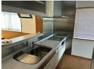
1階 キッチン、リビング 対面キッチンなので家族を見守りながら調理ができます 気軽にくつろげる小上がりスペースあります♪ リビングからサンルームに続いています