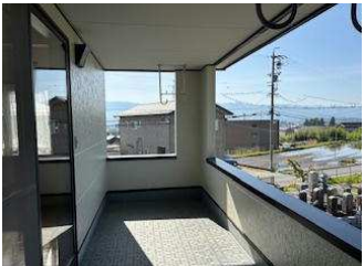
陽当たり、眺望の良いベランダ 住宅内収納豊富、屋根裏収納もあります