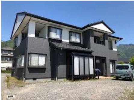
陽当たり・眺望の良い住宅 駐車4台可能です