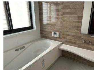
お風呂 洗面 トイレ 管理状態が良く清潔感のある水まわりです 浴室暖房乾燥機付きです 2階にも洗面、トイレがあります