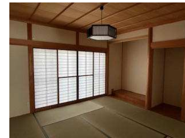
1階和室 玄関ホールから続く落ち着いた雰囲気のと室です