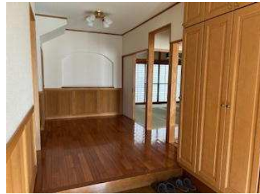
ゆったりと広く明るい玄関ホール 収納豊富なシューズボックスがあります