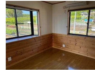
2階 木のぬくもりを感じるフローリングの洋室 洋室2部屋にはロフトあります