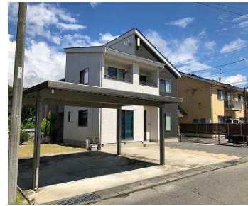
うれしいカーポートあります♪

平成30年新築 陽当たりの良い閑静な住宅地です JR下平駅まで徒歩4分、大型スーパー、ホームセンター等 毎日の暮らしに便利なお店が徒歩圏内にあります♪