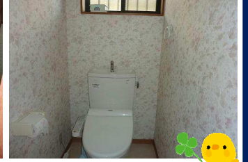
2階和室 各部屋に収納豊富な押入れ・洋服ダンス等あります 水まわり 浴室・脱衣場はリフォーム済みです 洗面 トイレは2箇所あります(温水洗浄便座付き)