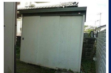
外観 利便性・陽当りに恵まれた立地 朝陽が差し込む快適な生活環境 居心地の良い住まいを♪ 敷地面積約79坪 建物面積約46坪