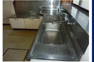
玄関周辺 ゆったりと広く明るい玄関ホール 収納豊富なシューズボックスがあります 1階キッチン 壁付けL字型キッチンは作業スペースも広々しています