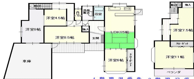
1階現況優先 2階現況優先